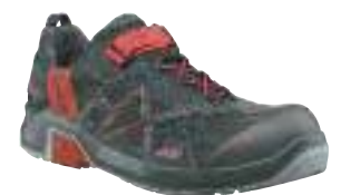
130H630003 / schwarz-rot