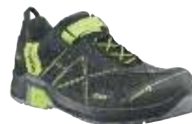
130H630010 / grau-citrus

Sohle: Besondere Gummimischung und Konstruktion ist die Sohle besonders rutschhemmend und extrem widerstandsfähig gegen Verschleiß.