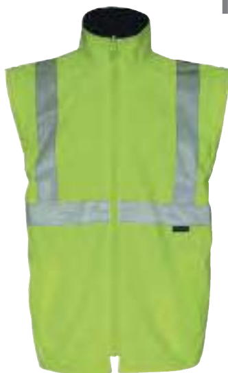
Innenjacke mit abnehmbaren Ärmeln.