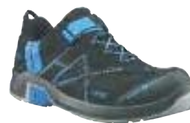
130H630002 / schwarz-blau