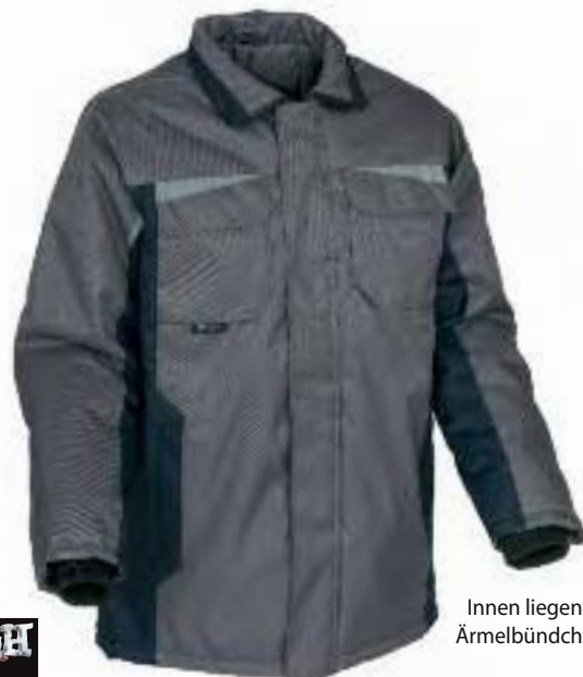
Innen liegende Ärmelbündchen