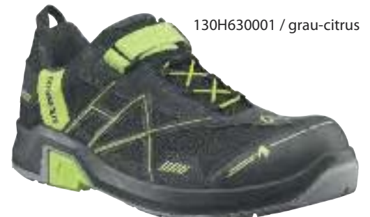
130H630001 / grau-citrus

Sohle: Besondere Gummimischung und Konstruktion ist die Sohle besonders rutschhemmend und extrem widerstandsfähig gegen Verschleiß.