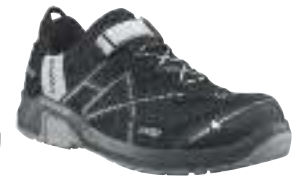
130H630004 / schwarz-silver

HAIX® Protective sole: Metallfreier HAIX® Durchtrittschutz schützt vor dem Durchdringen spitzer Gegenstände.